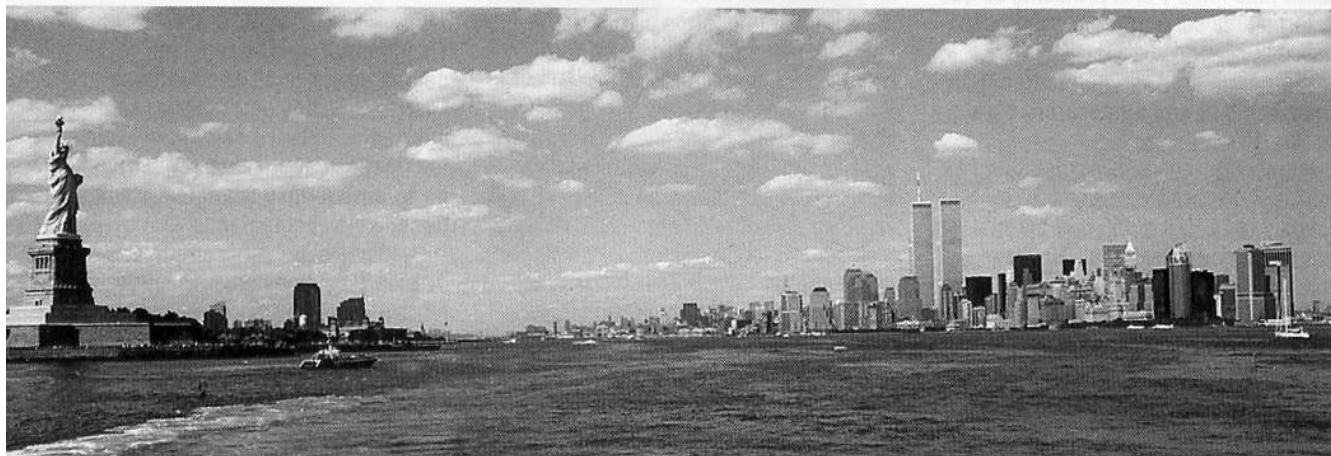
Perfiles urbanos: efectuada con una cámara de 35mm y una lente granangular, luego se recortó la parte superior e inferior para hacer una foto panorámica.

L a mayoría de la gente fotografía edificios y paisajes en las ciudades como recuerdo de un viaje o del lugar en que viven, pero el paisaje urbano puede ser más que una simple fotografía. Nos obliga a concentrarnos en la observación y percepción del espacio, a pensar en el mejor tipo de lente y en los elementos compositivos que puedan enriquecer nuestra imagen. Una cosa es mirar y otra cosa es verlo fotográficamente, es decir visualizarlo.