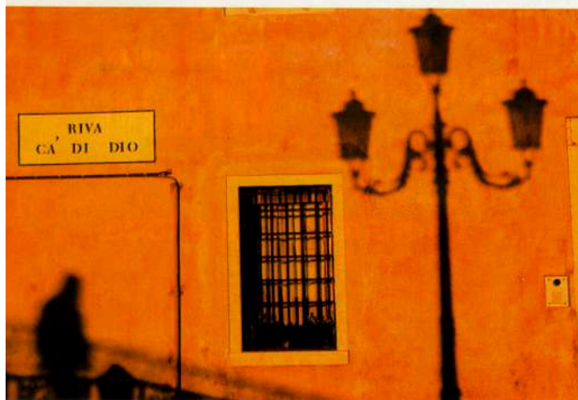
Luz rasante: se sacó provecho del crepúsculo para acentuar las sombras largas que recortan la figura de una persona y de la farola.

un día nublado o al amanecer o crepúsculo. Eso nos permite sacarle partido a las luces rasantes que acentúan la forma de los edificios y sus sombras. Técnicamente se pueden hacer este tipo de tomas con cámaras panorámicas, con el cuidadoso ensamble de varias fotos en horizontal o con la utilización de un granangular extremo. Después, debemos recortar la parte superior e inferior de la fotografía para que provoque la sensación de panorámica.