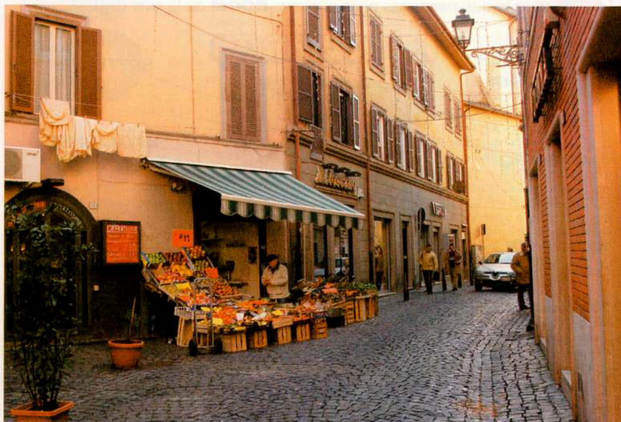
Ambiente urbano: pintoresca situación en un pequeño pueblo de Italia donde el punto de atracción es la verdulería, pero las viviendas y el cromatismo dado por el ocre del entorno, le dan una belleza particular.