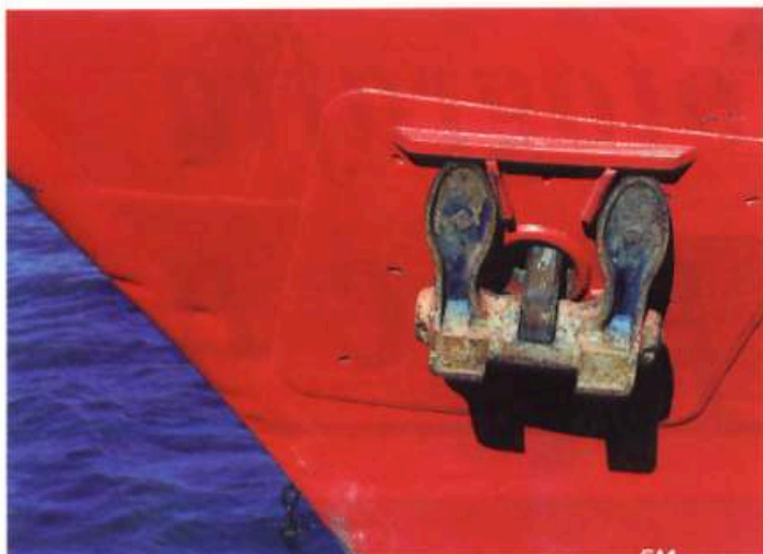
Juego de forma y color. Un fondo rojo de alto impacto visual que recorta la definida forma del ancla, un pequeño triángulo azul del mar que por contraste se despegue de la proa del barco.