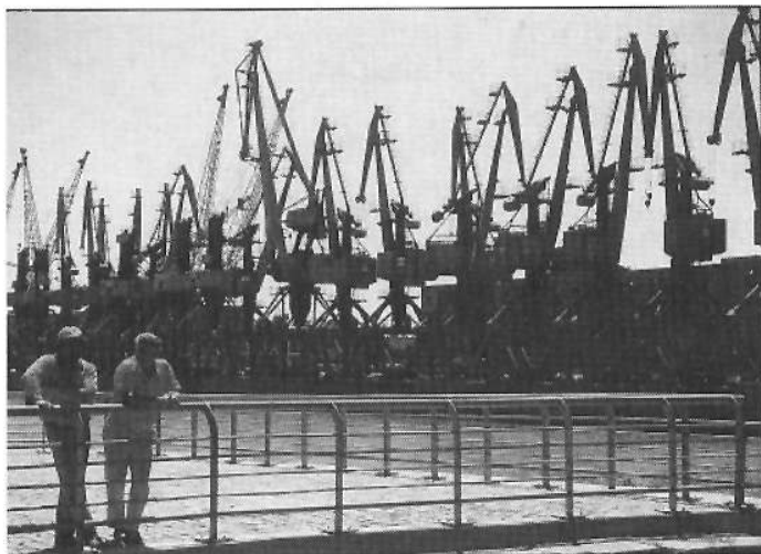
«Como las formas repetidas son muy fotogénicas, se han convertido en un motivo fotográfico. No deberían utilizarse nunca por su interés, sino como parte integral de una fotografía», Andrés Feininger.