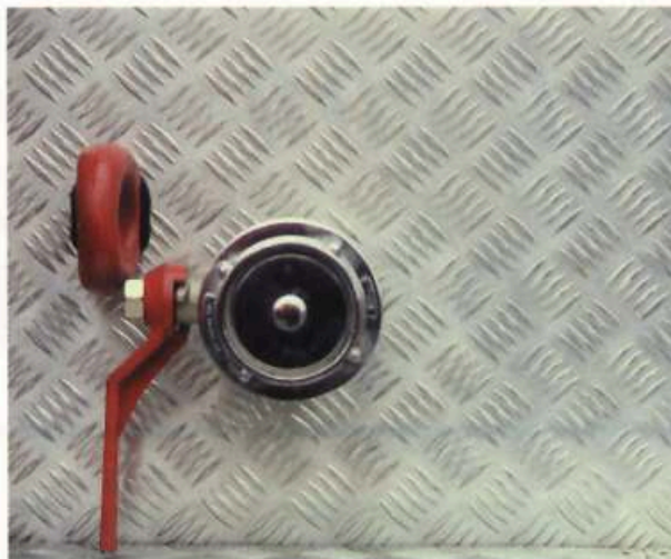
Generalmente los puntos principales de atención en una composición están dados por la presencia humana y por la luz o puntos de luz. En este caso particular que están ausentes, lo da el color rojo, acompañado por una forma redonda definida y secundado por un ritmo gráfico de fondo.