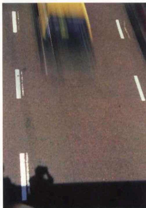
Efecto movimiento, punto de vista alto. Composición semi abstracta lograda a partir del correcto manejo de la técnica fotográfica, velocidad baja, diafragma cerrado.

La intención nunca fue imponerlas, sino transmitir las diferentes formas de cómo se puede organizar una correcta imagen. Para aquellos lectores que las siguieron, el consejo es que las utilicen como una guía y sepan sacarle provecho; y para quienes se están iniciando, que sepan encontrar una