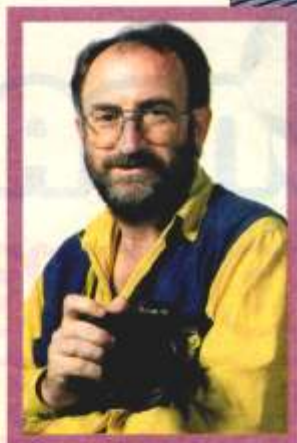
Vicente Viola, fotógrafo urbano