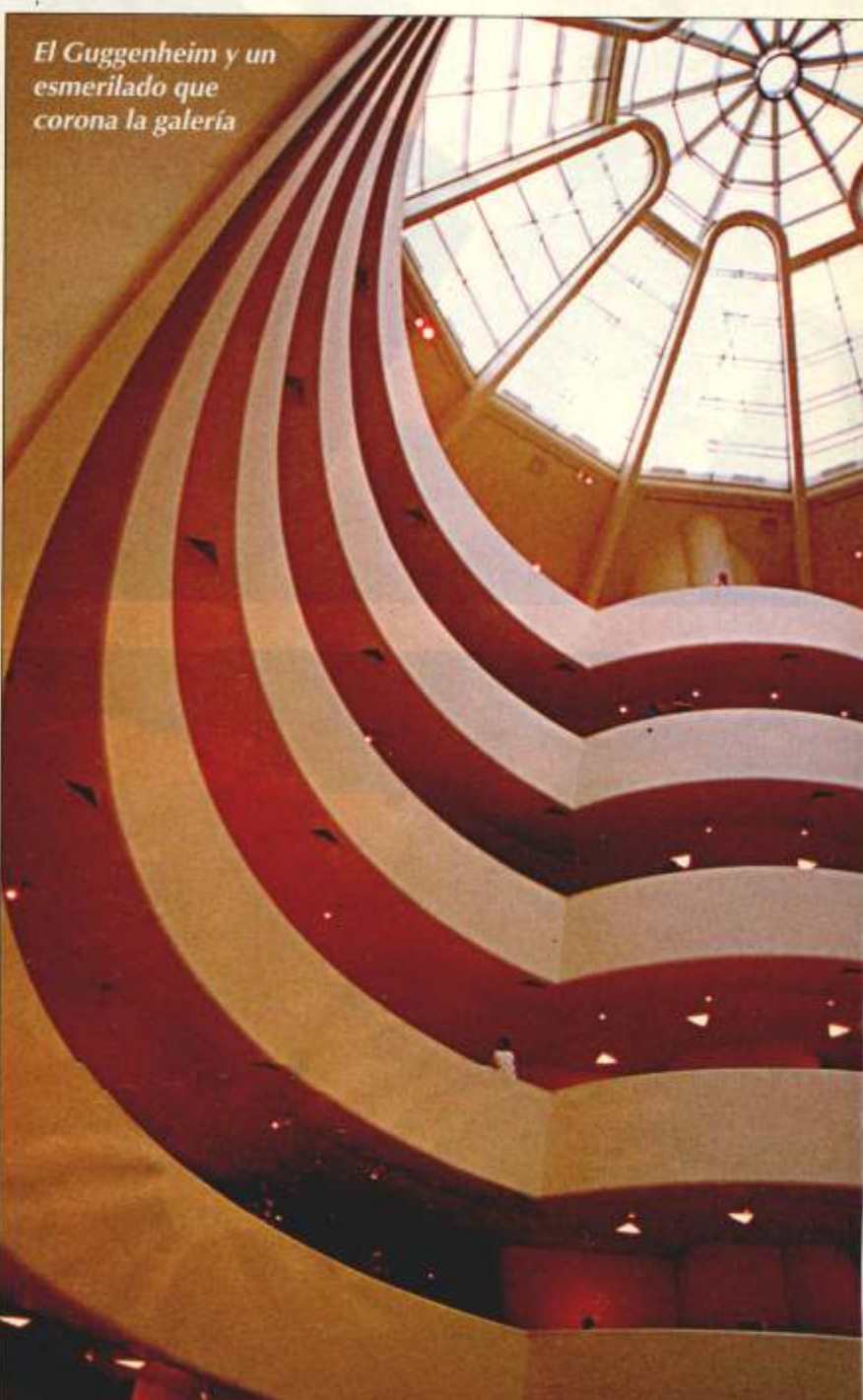
El Guggenheim y un esmerilado que corona la galería

Platense por adopción, Viola asegura que su lugar de expresión está en la arquitectura de las ciudades, en sus personajes, en los detalles y en la búsqueda de formas y colores. Por eso, cuando habla de su paso por Nueva York , dice que no le alcanzaron los ojos para ver esa mezcla de razas, esos colores metropolitanos, y ese contraste riquísimo entre la vieja y moderna arquitectura. Con más de 10 años en el dictado de cursos de fotografía en la facultad de Arquitectura y Urbanismo de la UNLP , Vicente cuenta que cuando llegó a los pagos de Woody Allen se propuso quitar de la escena a aquellos «elementos que molestan», como carteles, fachadas y autos, para transmitir una síntesis de los aspectos arquitectónicos más característicos de la ciudad, «anduve siempre mirando hacia arriba -dice-, buscando esos detalles que rara vez se observan cuando uno tiene la mirada a la altura de los ojos».