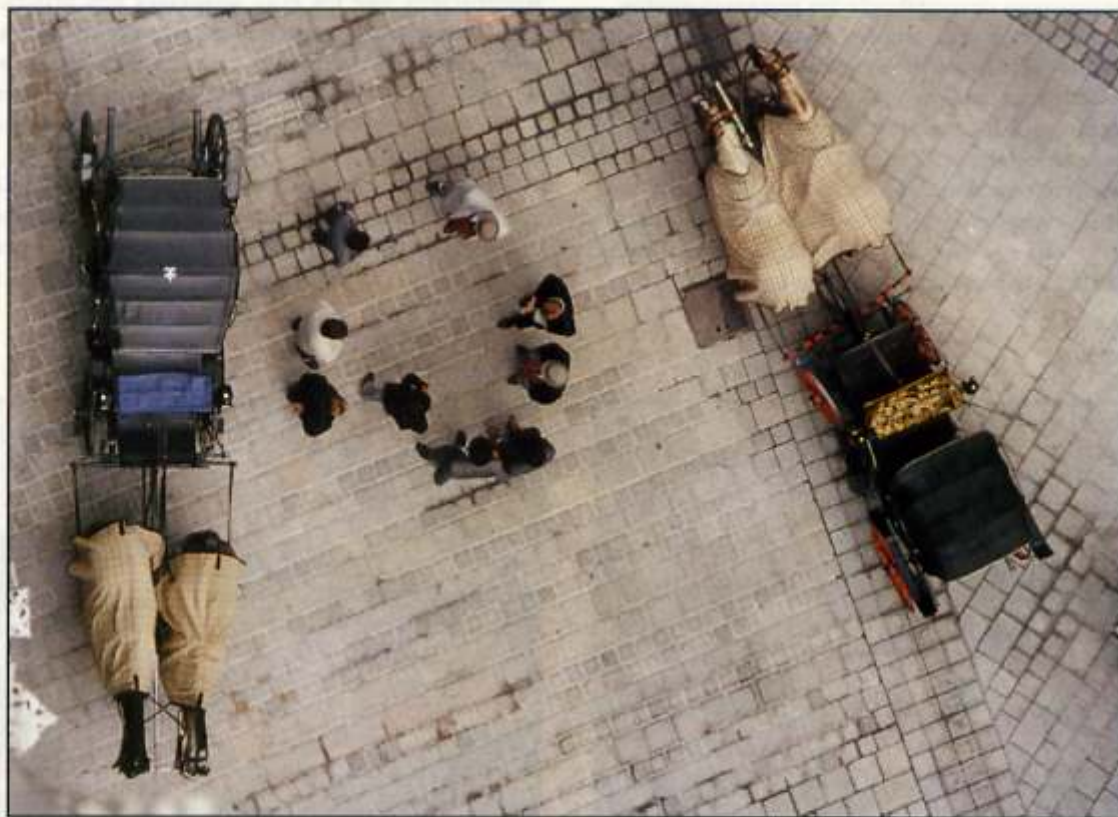
Ángulo de toma alto y extremadamente picado, donde el fondo de los adoquines recorta y ambienta esta particular reunión de conductores de Mateos

Si la situación a resolver es fotografiar un edificio