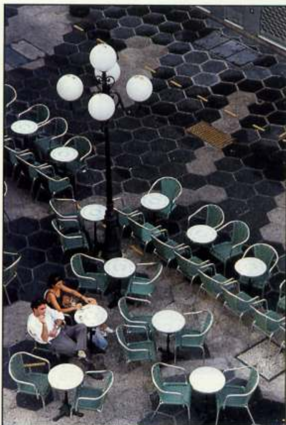
Imagen tomada desde un punto de vista alto, desde donde se aísla a las dos personas dentro de un espacio y ambiente rodeado de elementos urbanos, sumamente cargados de ritmo visual geométrico (círculos, hexágonos y diagonales).

Para que la fotografía de un ambiente o espacio no sea un mero documento de registro, se requiere de cierta técnica, imaginación y observación. Generalmente, un espacio urbano está concebido para la gente, por lo tanto la escala humana es casi imprescindible en el momento de fotografiar. Debemos intentar “ver” que es lo que le confiere más interés a ese espacio o edificio y tratar de reflejar ese hecho, pero con ojos de fotógrafo.