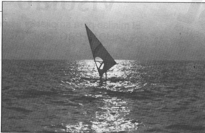
Composición simétrica, el punto de interés de esta foto es totalmente central. La vela, la presencia humana, el reflejo del sol, todo ocurre en un solo punto de la imagen, el resto de la foto no transmite nada. Si podemos imaginarnos esta foto separando la vela del reflejo en el mar, donde el horizonte no esté en el centro, y no corte la vela al medio, tendremos una foto con mucho más interés y recorrido visual.