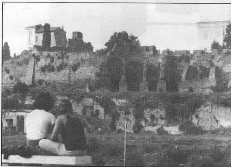
Composición asimétrica, el punto de interés principal de esta foto lo da la pareja sentada en el banco, que al estar descentrada dentro de la imagen y mirando hacia las ruinas, nos ofrece una lectura visual más agradable generando un movimiento visual dentro de la foto: miramos la pareja como primer impacto, luego el fondo y viceversa. En este caso para separar los planos se jugó con el enfoque y desenfoque, donde el primer plano está fuera de foco y el segundo plano bien definido, es una manera de transmitir profundidad a la imagen.